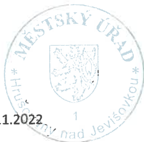
Ing. Zdeněk Šalomon tajemník městského úřadu

Proti tomuto rozhodnutí se podle ustanovení § 59 odst. 2 zákona o volbách do zastupitelstev obcí může volební strana, která podala kandidátní listinu, domáhat do 2 pracovních dnů od doručení uvedeného rozhodnutí ochrany u soudu, kterým je podle § 61 zákona o volbách do zastupitelstev obcí příslušný Krajský soud v Brně. Rozhodnutí se podle ustanovení § 23 odst. 4 zákona o volbách do zastupitelstev obcí považuje za doručené třetím dnem ode dne jeho vyvěšení na úřední desce registračního úřadu, který jej vydal.